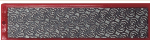
SP3026 DIAFACE MOONFLEX #200 (COLOR: RED) ¥4,200 (本体価格 ¥4,000) MADE IN ITALY