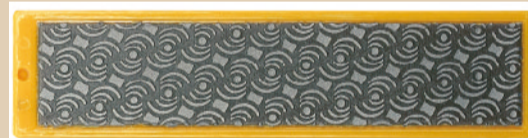
SP3027 DIAFACE MOONFLEX #400 (COLOR: YELLOW) ¥4,200 (本体価格 ¥4,000) MADE IN ITALY