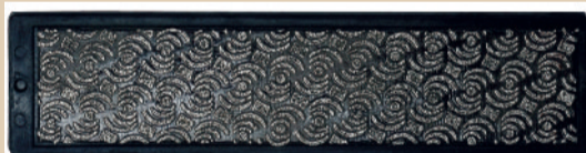
SP3025 DIAFACE MOONFLEX #100 (COLOR: BLACK) ¥4,200 (本体価格 ¥4,000) MADE IN ITALY