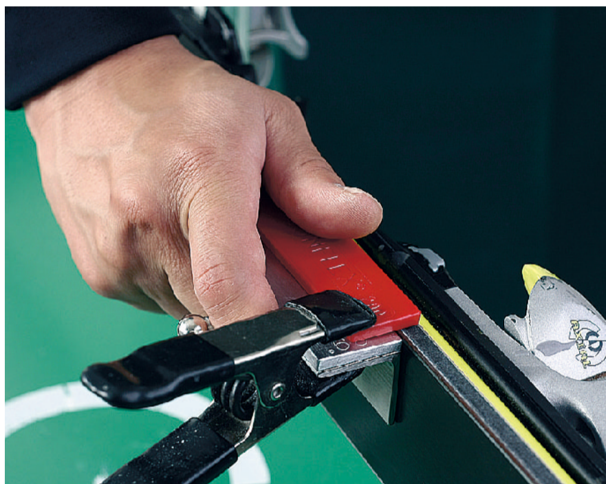
ダイヤフェイスを前後に動かします。

通常、ダイヤファイルは目詰りしやすいのが難点になっていました。しかしダイヤフェイスは新形状のムーンフレックス形状(三日月形)にする事により削リクズが溜まりにくく目詰りしにくい形状になっています。