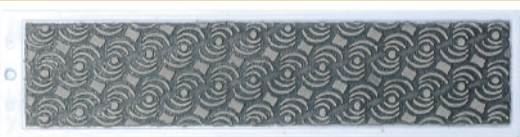
SP3028 DIAFACE MOONFLEX #600 (COLOR: WHITE) ¥4,200 (本体価格 ¥4,000) MADE IN ITALY